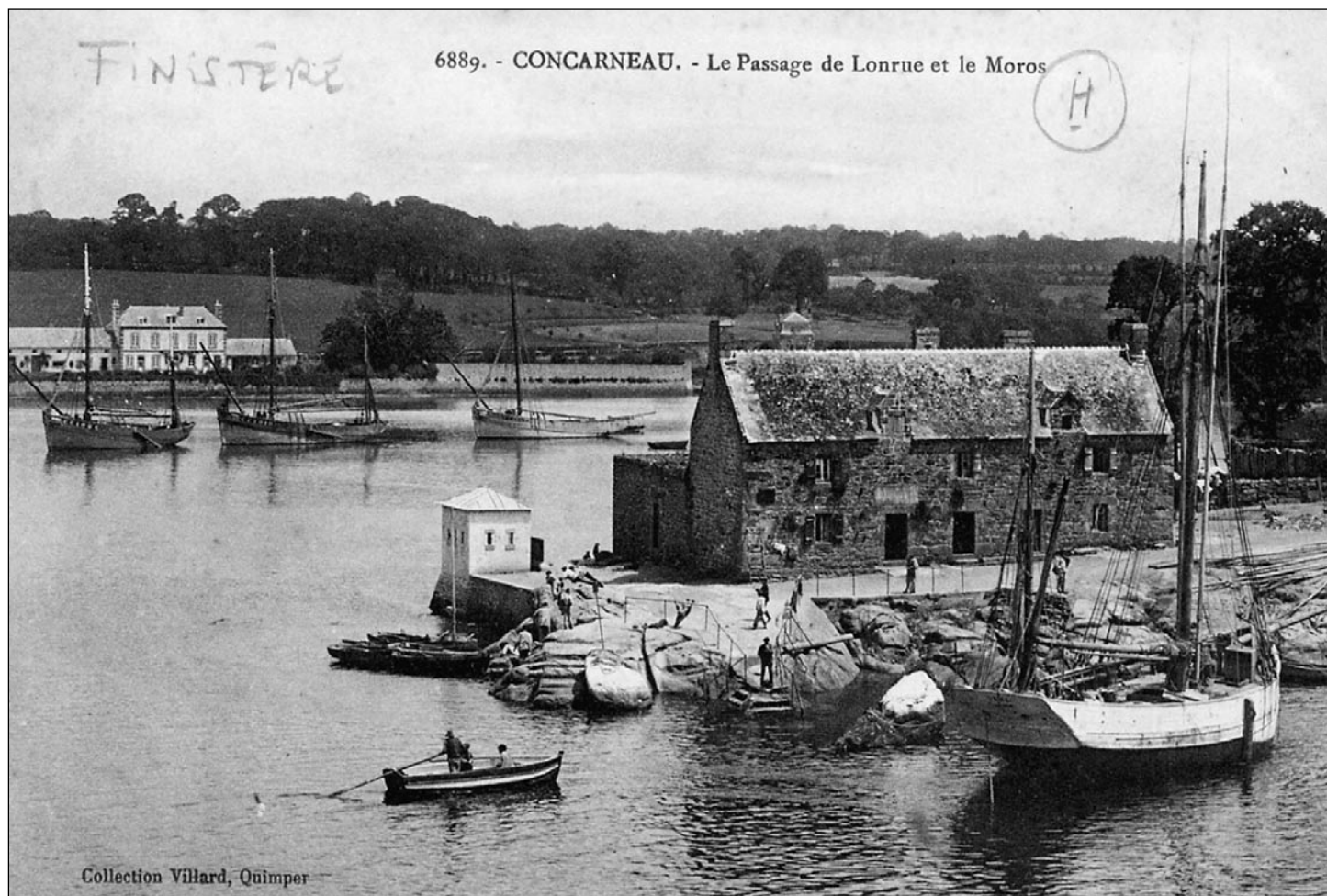
Belle image des débuts du Passage-Lanriec, devenu «Lonrue» sur la carte postale ! Les Thoniers se reposent sur le Moros.