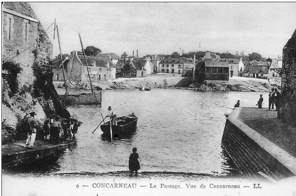
9 — CONCARNEAU — Le Passage. Vue de Concarneau — LL

Pas toujours facile d'aller chercher les clients. Collection Archives municipales de CC