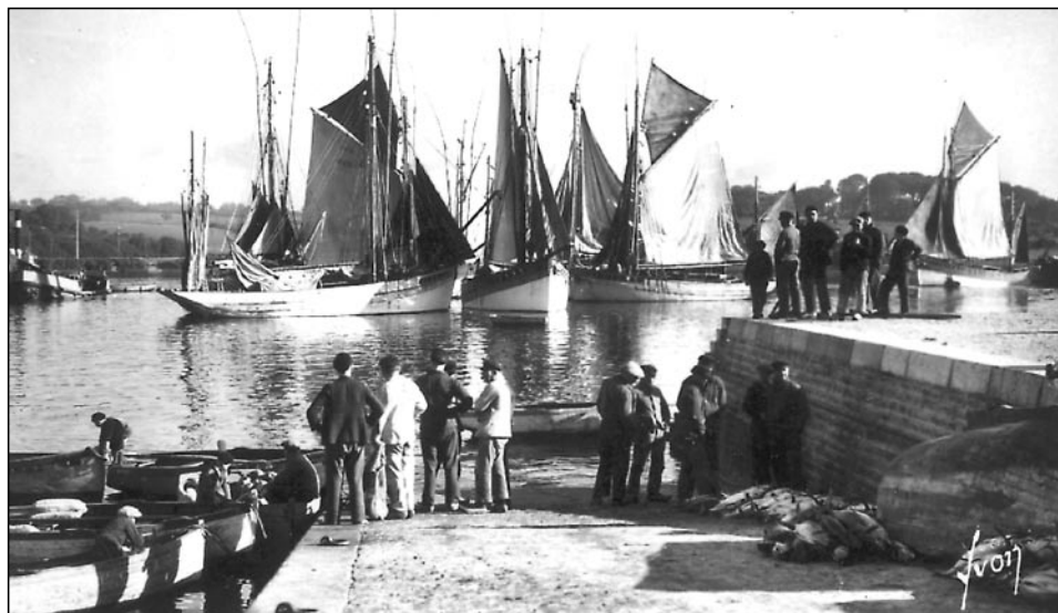
Image classique de la belle époque, celle qui a tant séduit les photographes et les peintres. Sur fond de thoniers au repos et sous voile, les pêcheurs rassemblés discutent tranquillement.